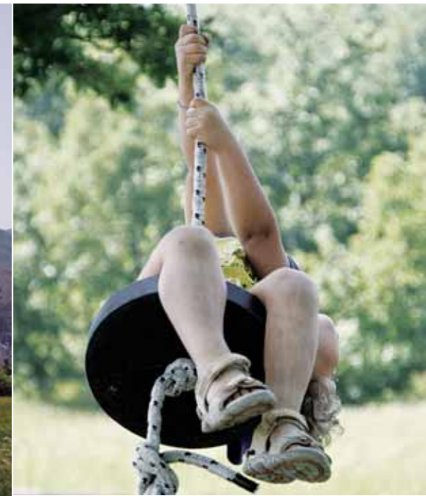
Alcune immagini dell'eco-villaggio di Granara (articolo a pag.25), uno dei borghi a rischio di spopolamento in un'Italia dove la banda larga viaggia a macchia di leopardo.