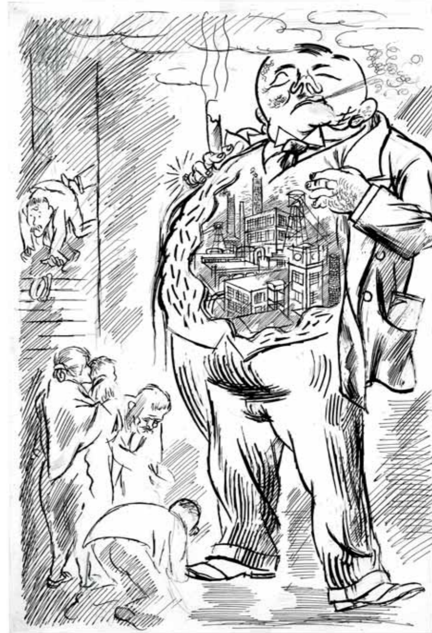
Il "Kapitalist", disegnato nel 1932 dal pittore tedesco George Grosz (Berlino, 1893 - Roma, 1959). Dalle sue posizioni politiche rivoluzionarie produsse per giornali e riviste numerose caricature e immagini satiriche.

Parlare di beni comuni, secondo l'accezione anglosassone dei commons , significa affrontare un duplice problema - la proprietà e l'utilizzo - secondo paradigmi diversi da quelli che attribuiscono al mercato la migliore governance nella gestione di tali beni. Mentre l'ideologia ultraliberista dispiegava i suoi effetti con la maggiore forza, la dicotomia Stato-mercato è stata messa in discussione, almeno dalla metà degli anni '90, anche all'interno dei santuari del Washington Consensus. Sotto la pressione delle proteste delle comunità locali nei confronti dei grandi progetti di sfruttamento dei beni comuni, la stessa Banca Mondiale ha raccolto una larga parte delle riflessioni accademiche, dando vita a una vera e propria strategia denominata CCD ( Community driven development , lo sviluppo guidato dalla comunità). È stata elaborata intorno al 2005 e declinata in azioni tematiche che sembrano uscire dal contributo di un no global : microfinanza, inclusione dei giovani, gestione delle risorse naturali, lotta alle malattie, sviluppo urbano sostenibile.