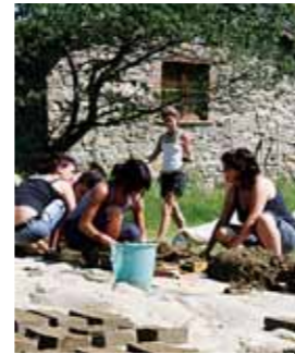
Nella foto grande, una casa dell'ecovillaggio di Granara. Qui sopra, un campo di lavoro organizzato nel villaggio.

Alla conversione agricola, però, il DESR vuole affiancare anche quella energetica. «Nel Parco Agricolo - spiega Biolghini - vogliamo costruire un sistema di relazioni sostenibili anche dal punto di vista dell'energia. Per questo abbiamo proposto alle famiglie progetti di autonomia energetica nei condomini e, alle cascine, abbiamo suggerito di sostituire i tetti in eternit con pannelli fotovoltaici». Un'iniziativa che sarà sostenuta con la creazione di appositi gruppi d'acquisto energetici. La scelta, tra l'altro, va nella direzione prevista dalla nuova Politica agricola comune dell'Ue che prevede di destinare i contributi in primis alle aziende che scelgono la multifunzionalità (ad esempio, produzioni agricole e di energie rinnovabili). ■